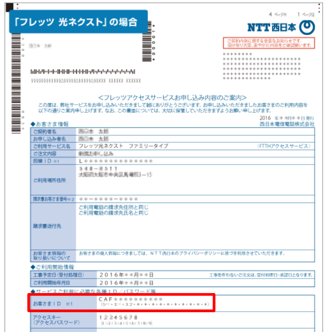
「お申し込み内容のご案内」のイメージ

※参考URL： https://fleets-w.com/user/about_id/