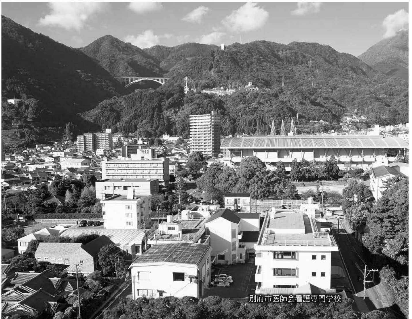
別府市医師会看護専門学校