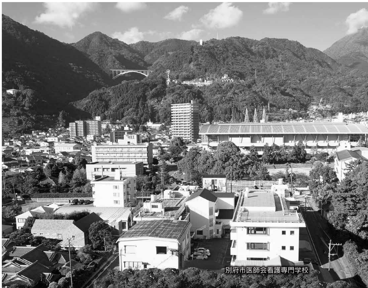
別府市医師会看護専門学校